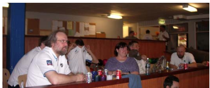
Den enorma publiken i stegfinalerna.