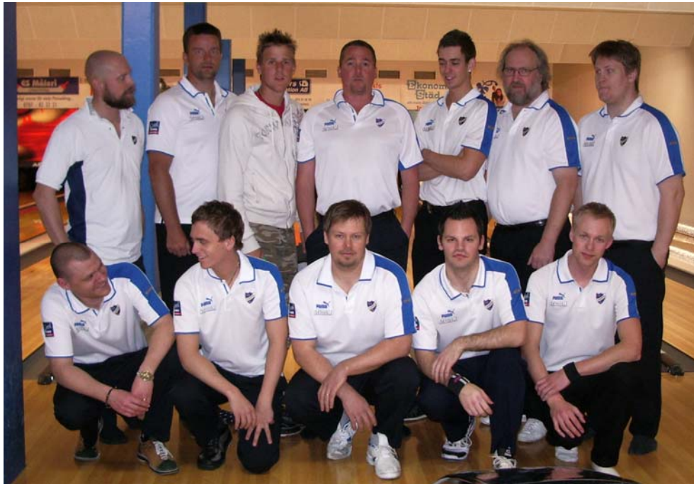
Tappa skaran IFK:are som ställde upp i årets klubbmästerkap.