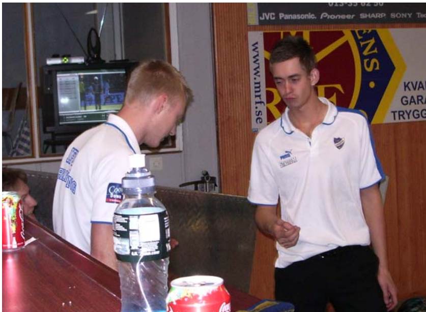
Tonna spanar in Masen. (!?!?!!!!!)