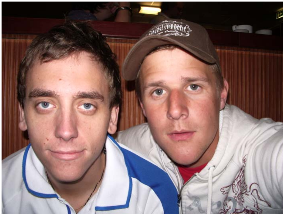
Återigen, kommentar överflödig.